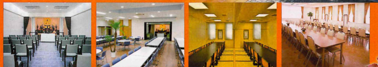
荘厳な空気に包まれた法要室(最大30名) ゆったりくつろげる広々としたロビー 2つの和室会食室(最大24名) 4つの洋室会食室(最大48名)

すべての施設が《バリアフリー仕様》を徹底したワンフロアなので、高齢者やお子様でも安心してご利用いただけます。