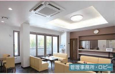
管理事務所・ロビー