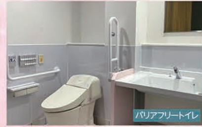
バリアフリートイレ