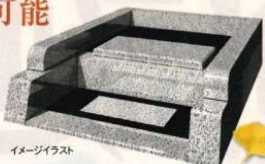
イメージイラスト