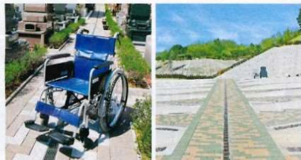
車いすをご用意しております 広い参道でお参りもラクラク!

お年寄りの方やお身体の不自由な方も安心してお参り いただける全区画バリアフリー設計となっております。 墓域の参道も広いので大変安心です。