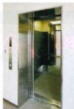
エレベーター完備

管理棟には常駐の管理人がおり ますので、いつでもお参りに来られて も安心です。また、法要・会食等 のご相談にも応じております。