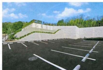
運転が苦手な方にも安心の広い駐車場

お車で安心してご来園いただけるよう、駐車スペース 全て平置き式の駐車場となっております。