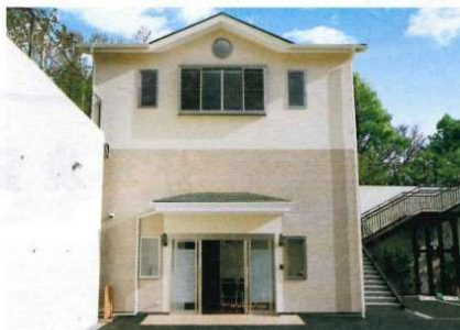
お気軽にご利用いただける管理棟