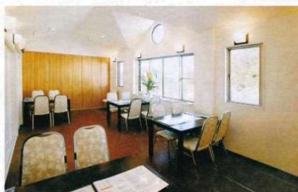
お参りの際にゆったりとくつろげる休憩所